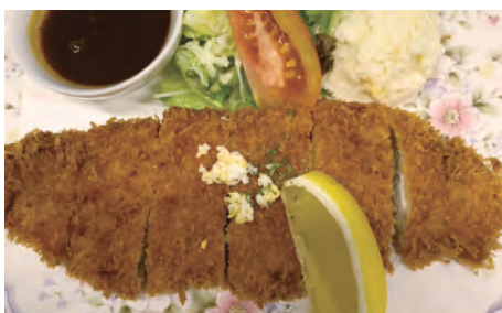
手仕込みさっくさく! とんかつ ¥850