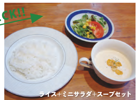
ライス+ミニサラダ+スープセット