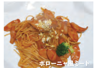
ボローニャ風ミート