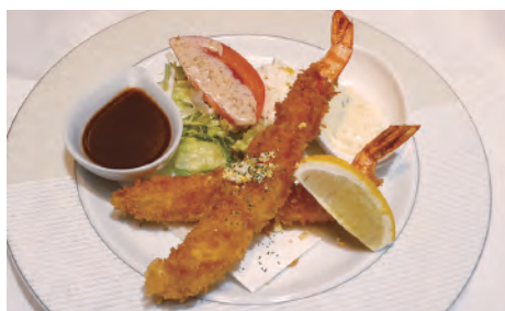
大きな海老フライ 二兄弟 ¥850