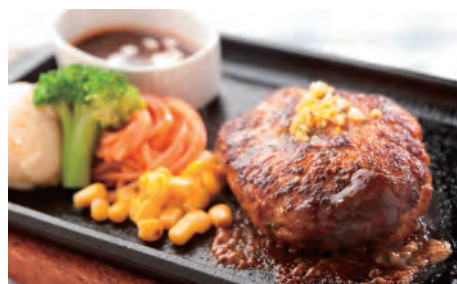
ジューシーハンバーグ ¥900