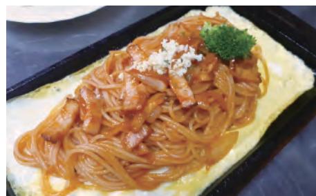
昔懐かしの 鉄板ナポリタン ¥990