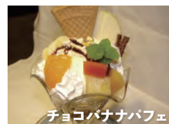
チョコバナナパフェ