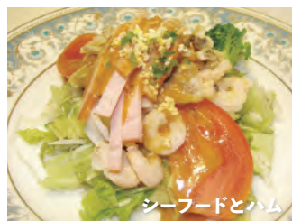
シーフードとハム