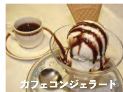
カフェコンジェラート