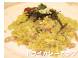
ドライカレーピラフ