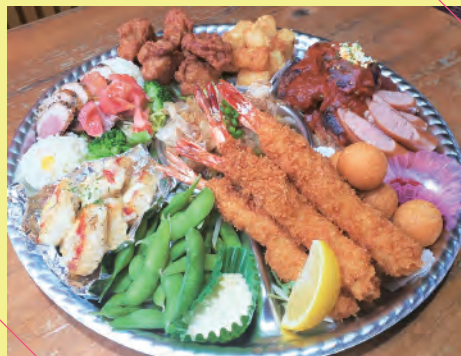
4～5人前 (約 40 cm) ¥6,800