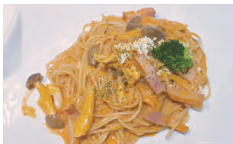
ベーコンとしめじの トマトクリームパスタ ¥1,100