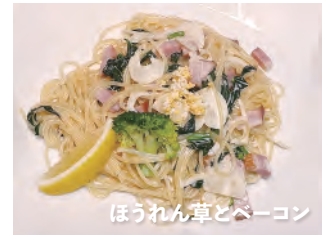
ほうれん草とベーコン