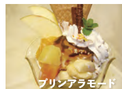
プリンアラモード