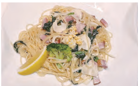
ほうれん草とベーコンの 生クリームパスタ ¥1,100