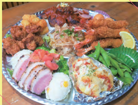
2～3人前 (約 30 cm) ¥4,500